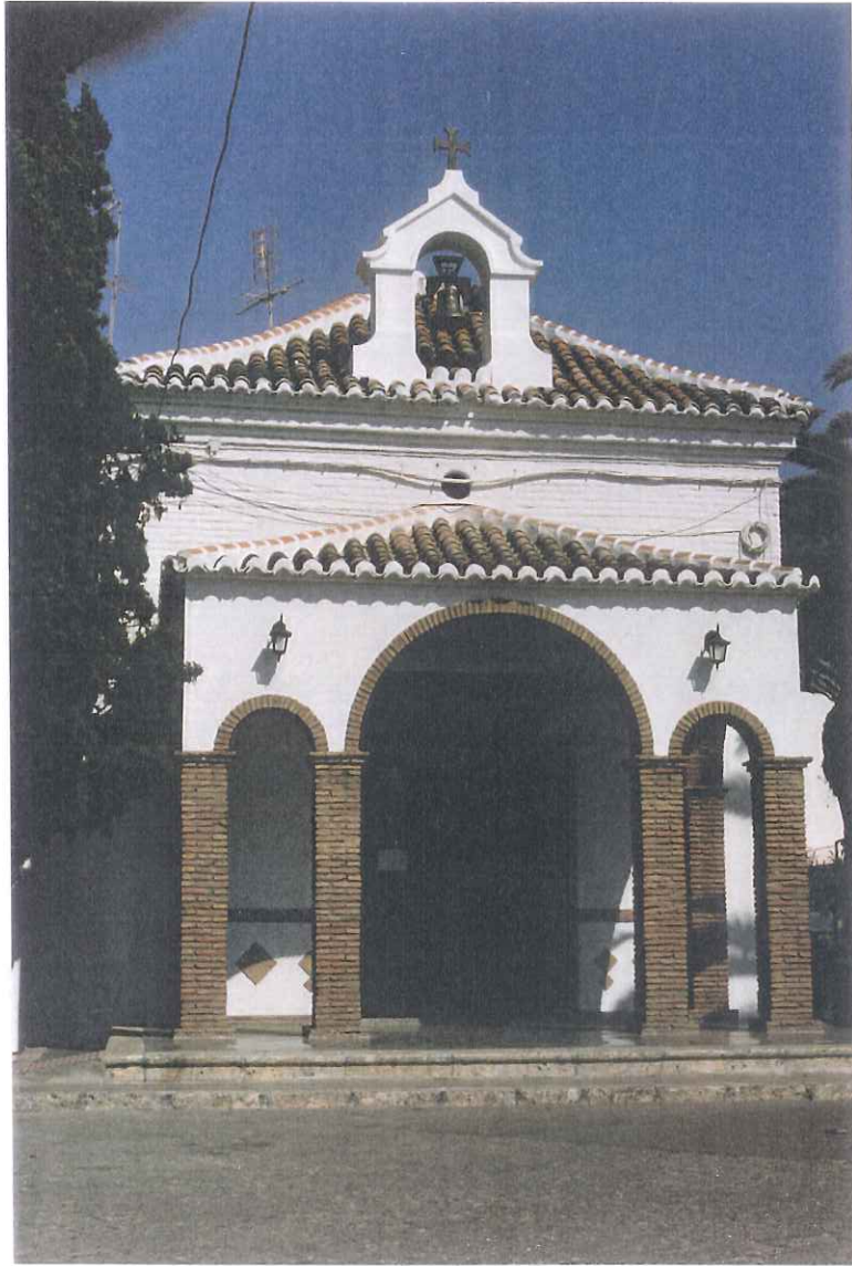
24- Ermita de Ntra. Sra. de las Angustias