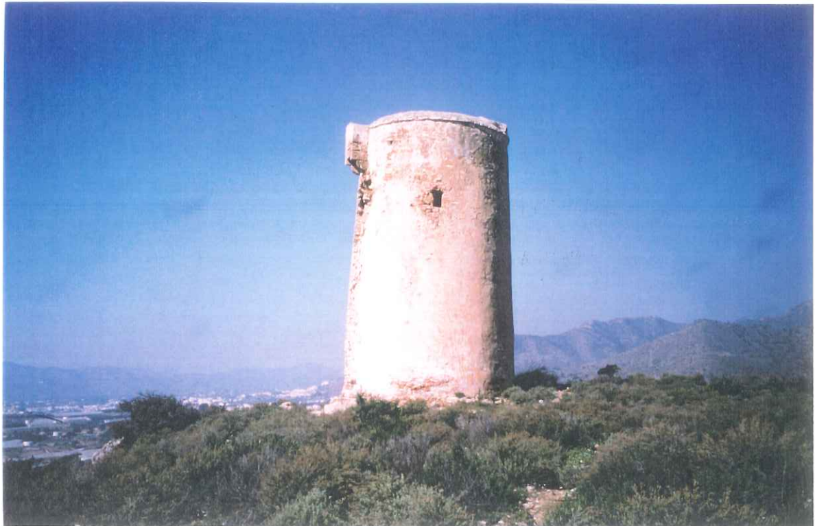
6- Torre vigía de Maro

APROBADO INICIALMENTE EN SESION PLENO 11. D.I.C. 1999 EXCMO. AYUNTAMIENTO DE NERJA