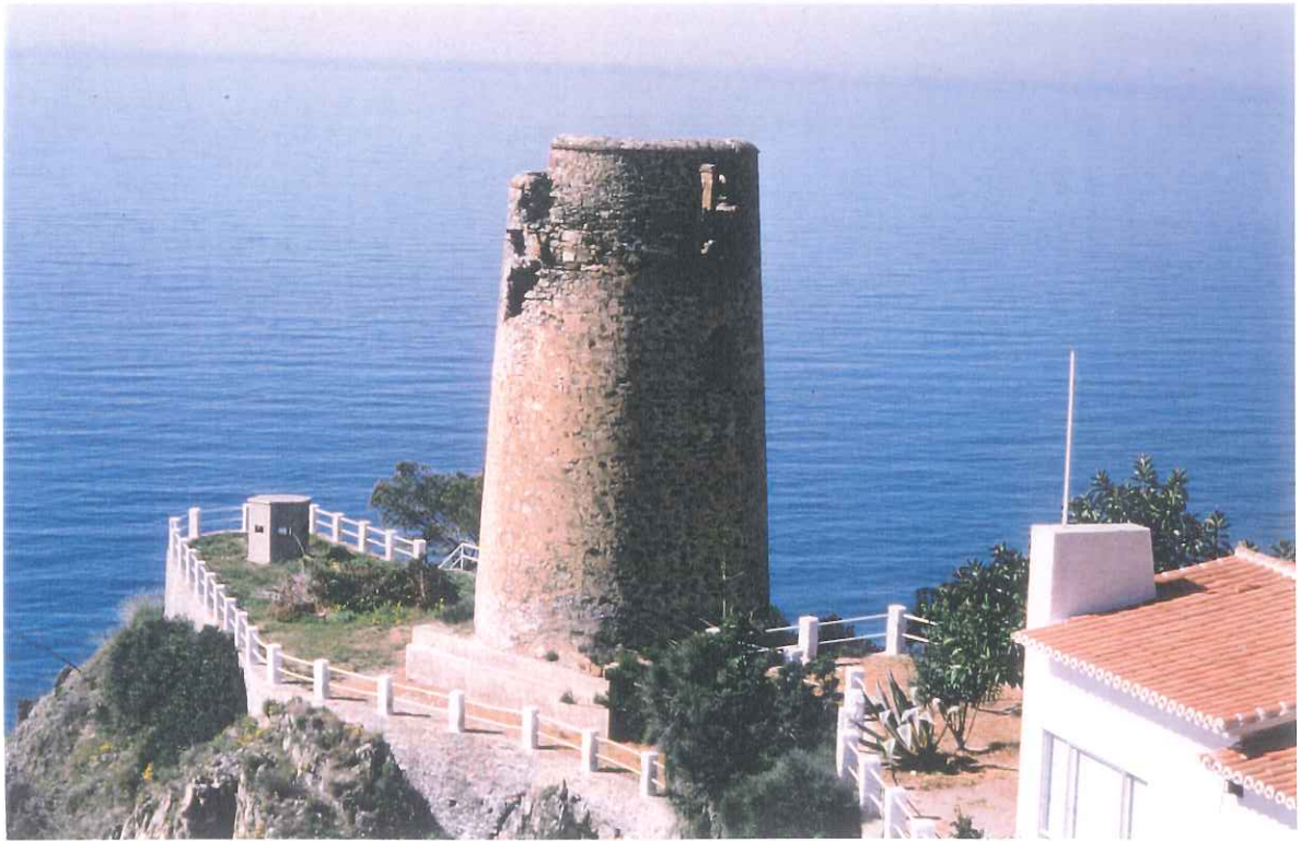
7- Torre vigía del Pino

APROBADO EN SESION PLENO 11. NOV 1999 ERGO. AYUNTAMIENTO DE HERJA