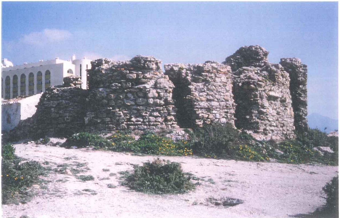
10- Torre vigía de Nerja. La Torrecilla