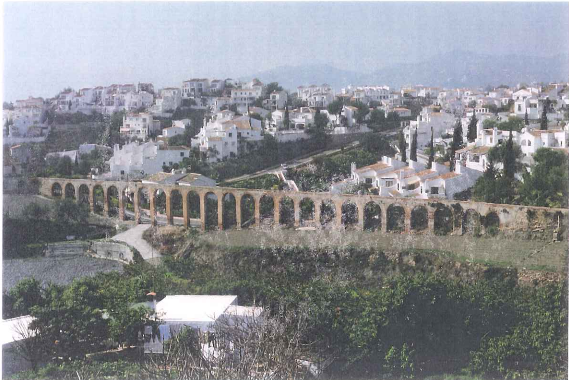
26- Acueducto Tablazo

APROBADO INICIALMENTE EN SESION PLENO 11. DICIEMBRE 1999 EXCMO. AYUNTAMIENTO DE HERJA