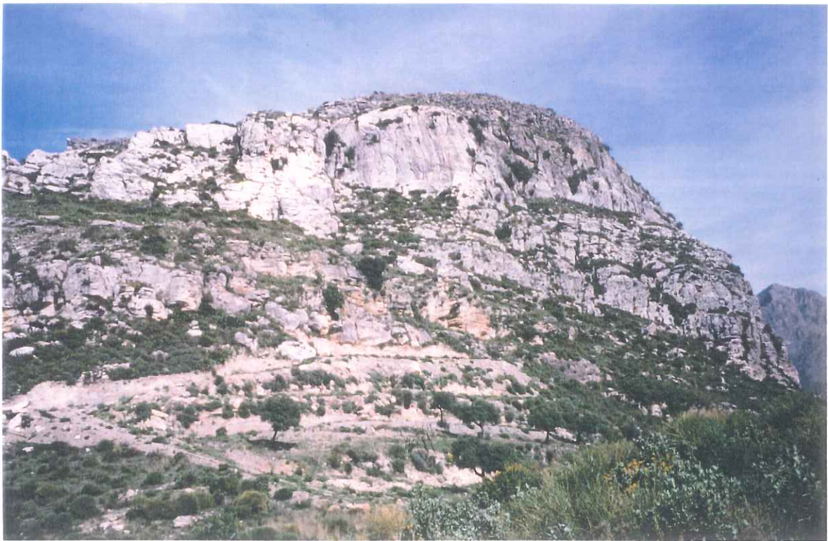
4- Castillejo del Río de la Miel

APROBADO INICIALMENTE EN SESION PLENO 11. DIC. 1999 EXCMO. AYUNTAMIENTO DE NERJA