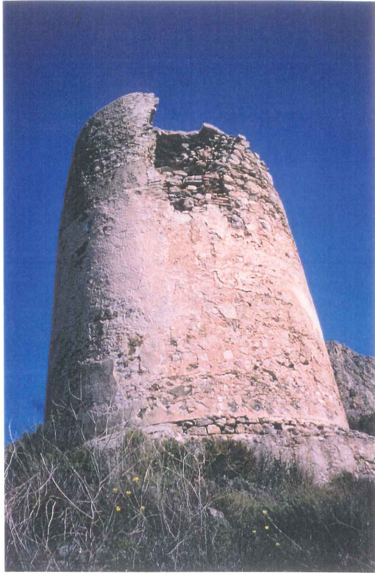
8- Torre vigía de la Caleta

APROBADO INICIALMENTE EN SESION PLENO 11. DIC 1999 EXCMO. AYUNTAMIENTO DE NERJA