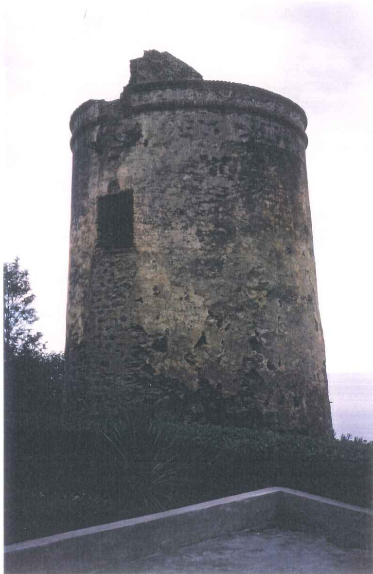
9- Torre vigía de Macaca