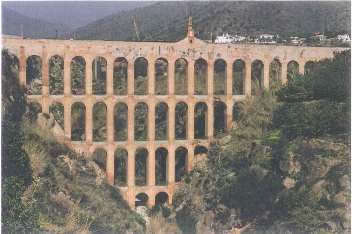
21- Acueducto del Águila