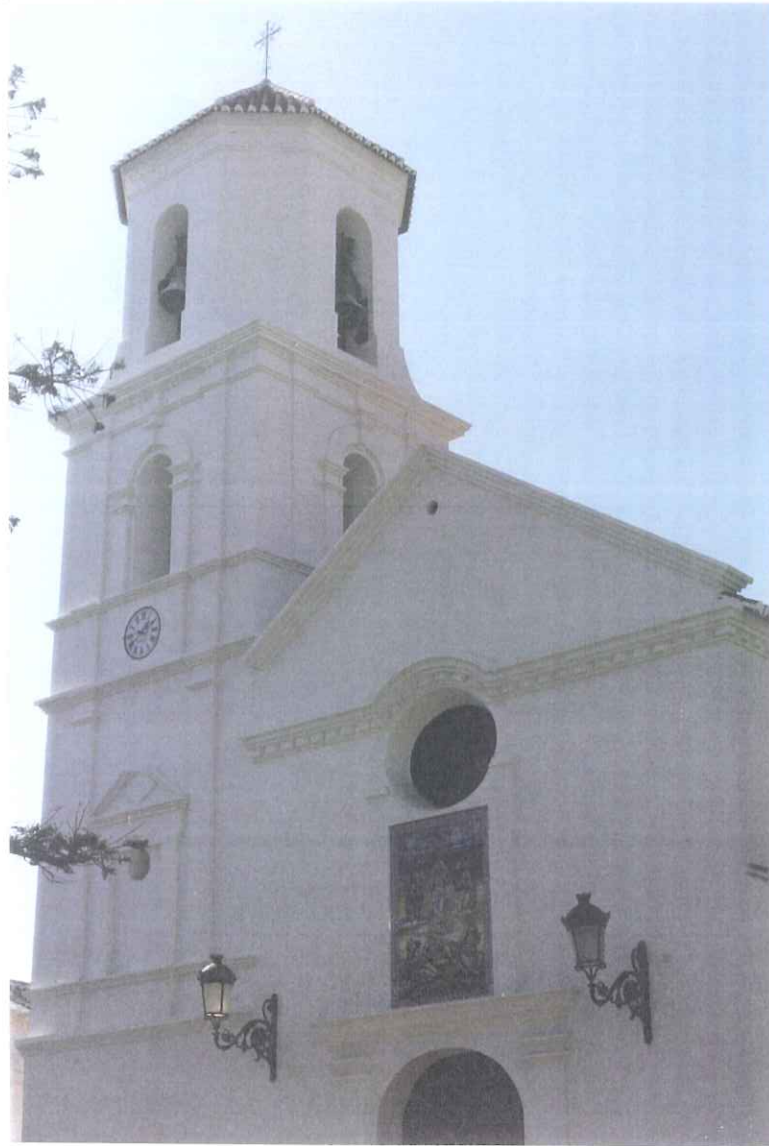
23- Parroquia de El Salvador

APROBADO INICIALMENTE EN SESION PLENO 11. DIC 1999 EXCMO. GOBIERNO DE NERIA