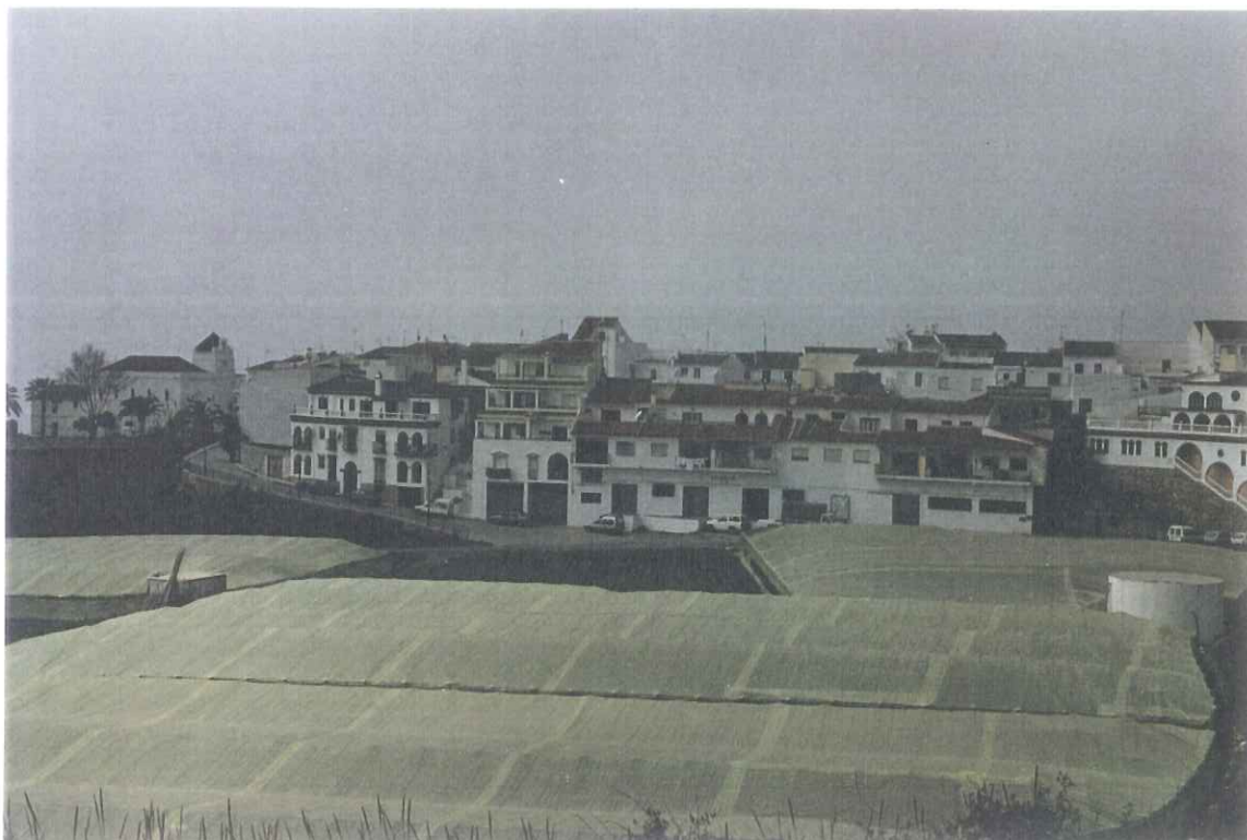
2- Alrededores de Maro

APROBADO INICIALMENTE EN SESION PLENO 11. DIC. 1999 EALMO. AYUNTAMIENTO DE NERIA