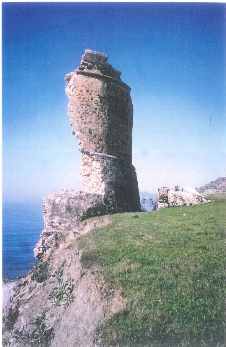
5- Torre vigía Arroyo de la Miel

APROBADO INICIALMENTE EN SESION PLENO 1. DIC 1999 EXCMO. AYUNTAMIENTO DE NERJA